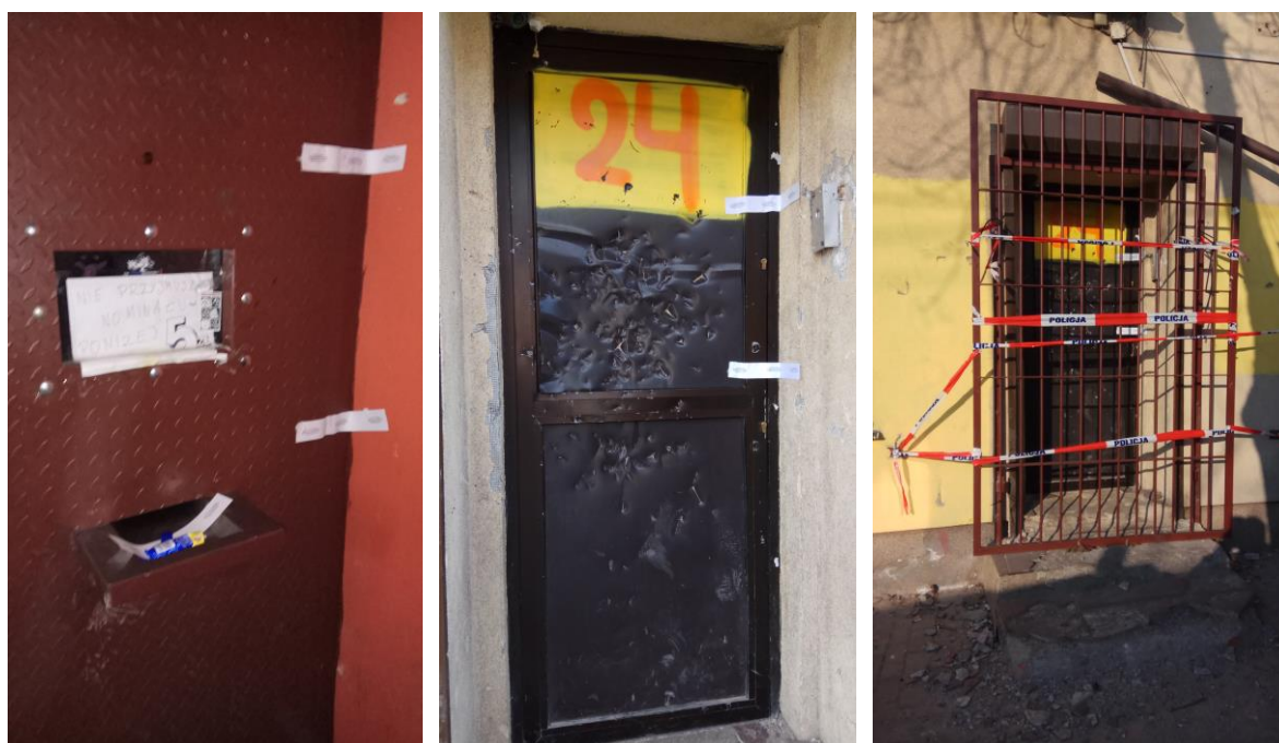
Pancerne drzwi wejściowe do sklepu przy ul. Zielonej 5.