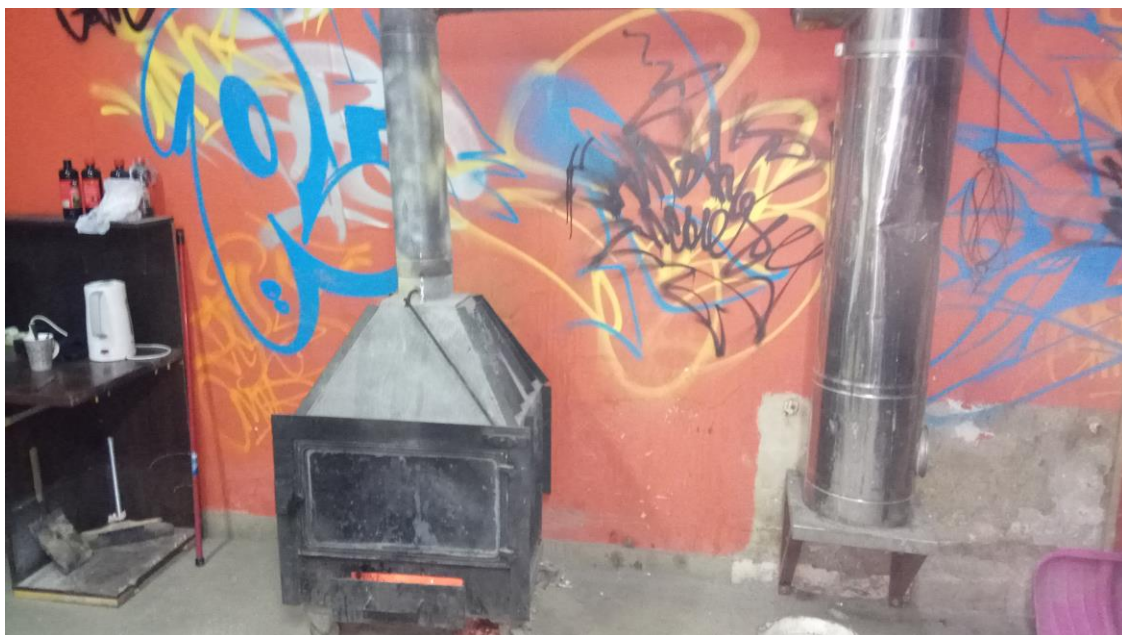
Wnętrze sklepu przy ul. Zielonej 5